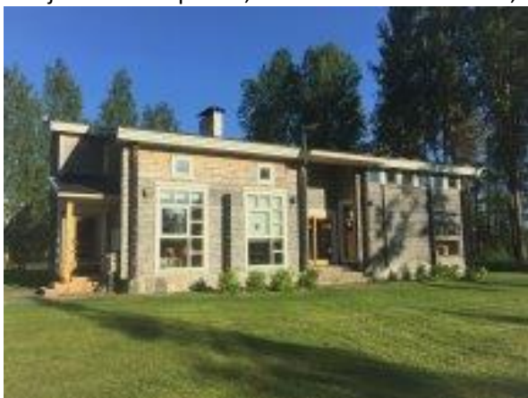
Ateljeetalo Tuulensuu, Kärnä, Viitasaari