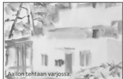
Aallon tehtaan varjossa.

LIITY AKVARTIN POSTITUSLISTALLE ja saat näyttelykutsut, galleriaakvart@gmail.com