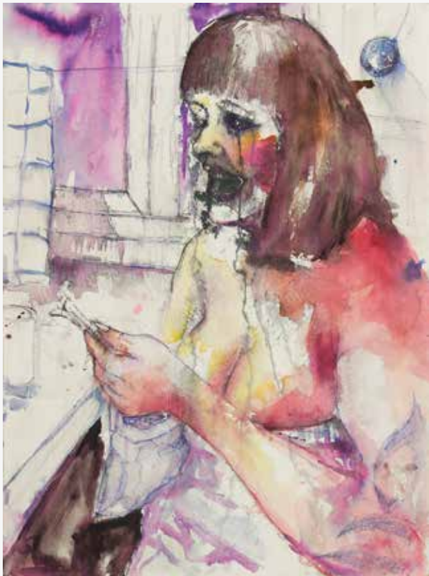
Anna mulle tähtitaiyas / Gimme the Starry Sky / 2012 ink painting / tussilaveeraus / 56 x 76 cm paperi:Fabriano Arches 300g