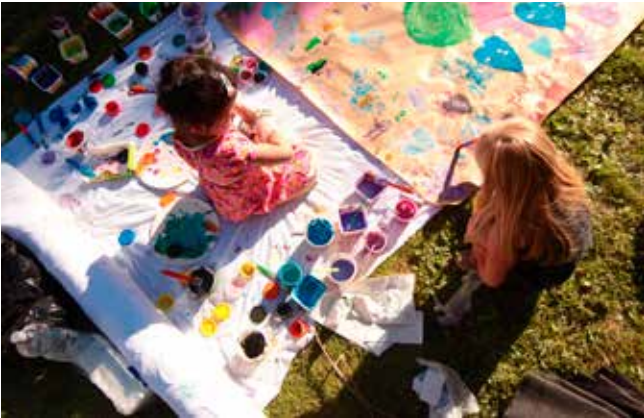
Kaustisen tapahtuma