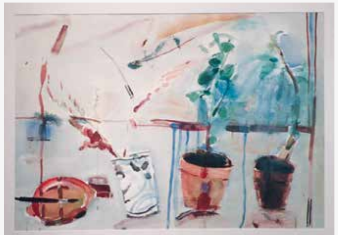
Carl Wargh: vas. "Mäntyjä rannalla" 2015 ja yllä "Asetelma 1990-luvulta", kuvaaja: Ulf Nyman, Seinäjoen taidehallin muistonäyttely