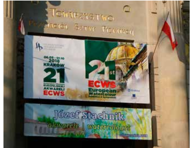
ECWS Krakova, kuva: Aulikki Nukala