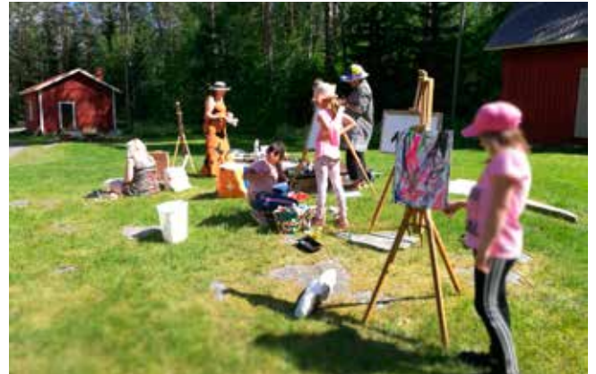
Siilinjärvi, Pöljän tapahtuma, kuvaaja: Hilikka Karvonen