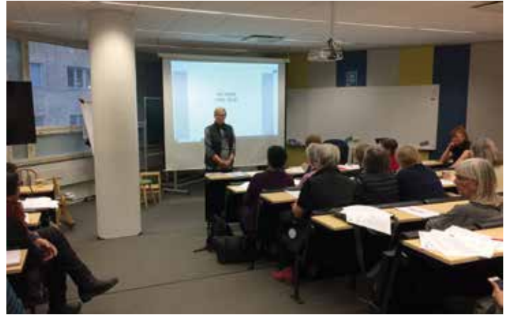
SAy:n sääntömääräinen syyskokous pidettiin Kalliolan settlementitalossa

Kokouksessa hyväksyttiin seuraavan toimikauden 2020 toimintasuunnitelma ja talousarvio. Yhdistyksen liittymis- ja jäsenmaksut pidetään ennallaan. Vuoden 2020 toiminnan painopistealueet ovat 1) Valtakunnallisen aluetoiminnan vahvistaminen, 2) Suuren Maalaustapahtuman kehittäminen, 3) Näyttely- ja koulutussuunnitelma kolmelle vuodelle ja 4) Toimintaohjeistusten laadinta toimikunnille. Yhdistyksen talous on kunnossa. Yhdistyksen toiminnan keskiössä on järjestää jäsenistölle kursseja sekä näyttelyitä. Näin jäsenistölle tarjotaan mahdollisuus tavata toisiaan, verkostoitua ja saada tietoa akvarelliin liittyen. Vuonna 2020 yhdistyksen aluevas- taavia aktivoidaan ja saadaan mukaan toimintaan.