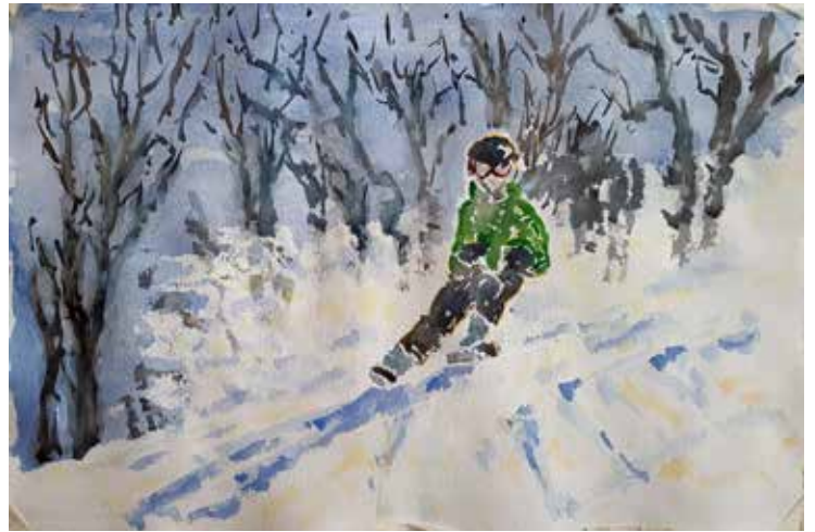
Ulla-Riitta Kauppi: Vauhdissa