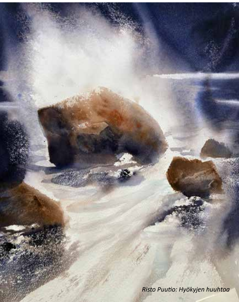
Risto Puutio: Hyökyjen huuhtoa