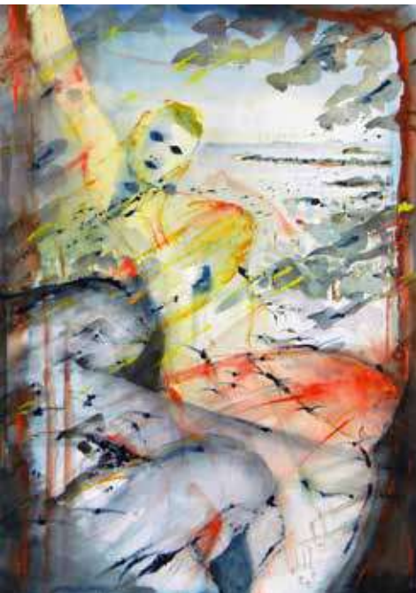
Axel Taegen: Dance macabre