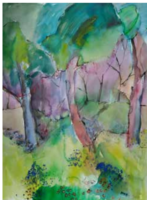
Kaija Mäenpää: Metsän rytmi