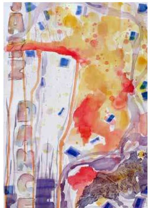
Merja Halminen: Jazz dance