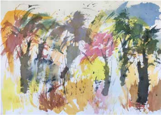
Pirkko Vuori: Villit puut