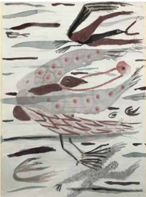
Maiju Talvitie: Myötätuulen puuska