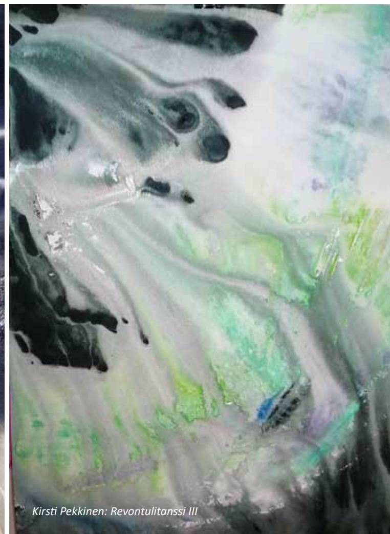
Kirsti Pekkinen: Revontulitanssi III