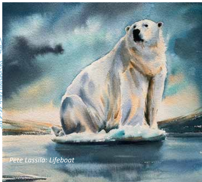
Pete Lassila: Lifeboat