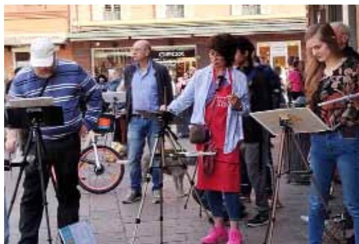
Piazza Nettunolla maalattiin monen päivän ajan yhdessä ja erikseen.