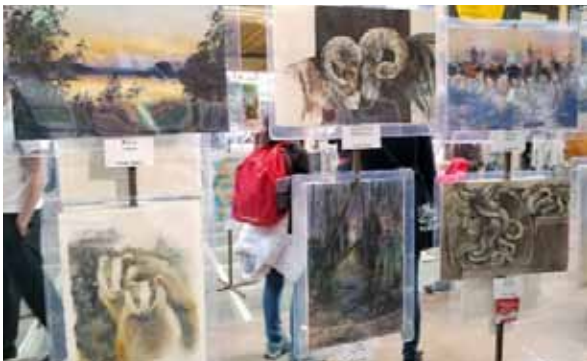
Suomen työt olivat hyvällä paikalla lähellä näyttelyn sisäänkäyntiä.

Sekä näyttely että konferenssi demoesityksineen ja workshoppeineen ja plein air -tapahtumineen oli keskitetty Bolognan historialliseen keskustaan, mikä takasi tapahtumalle tänä vuonna ennätysyleisön. Näyttelyyn tutustuja sai varmasti monipuolisen ja loistavan kattauksen kansainvälisestä akvarellitaiteesta, ja siitä kuinka paljon akvarellimaalauksen kulttuurit eroavat eri